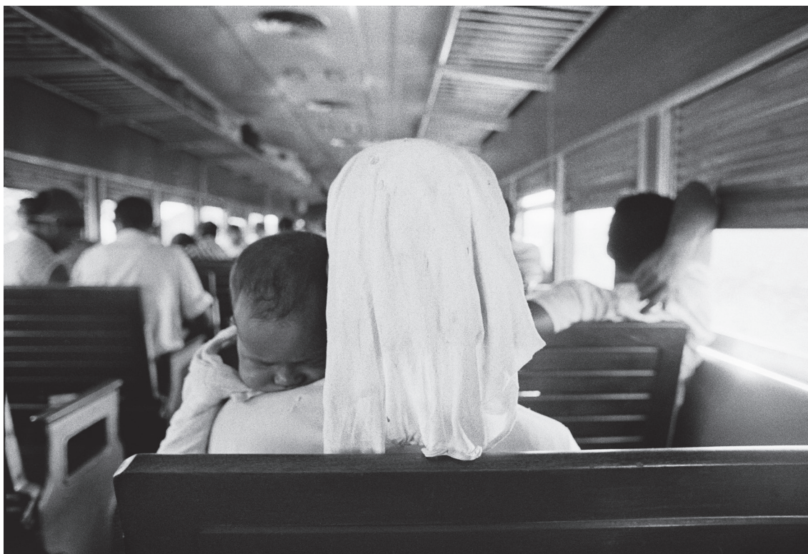
Tren baiano , Fotografía de Claudia Andujar , de la serie Historias reales (1969). Impresión con tinta pigmentada mineral sobre papel de algodón, 73 x 110 cm.

* Psicoanalista, Miembro de la Asociación Psicoanalítica de Uruguay (APU), Editora de Calibán – Revista Latinoamericana de Psicoanálisis